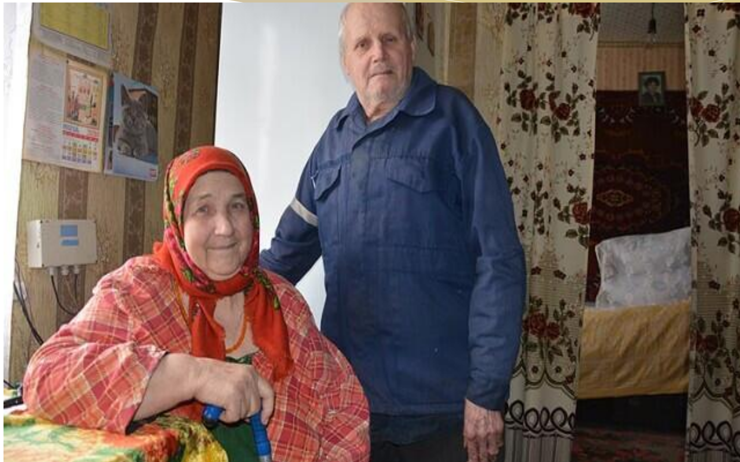
ФОТО ИЗ х. БЫЧКОВО